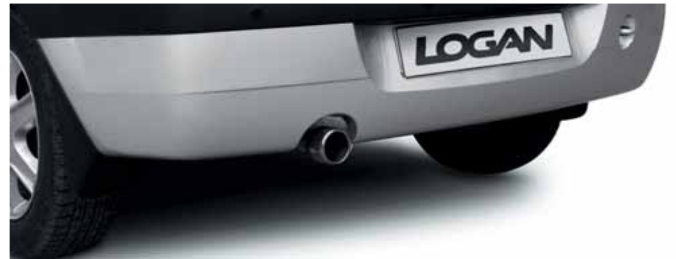
ЛИТЫЕ ДИСКИ • ДЕКОРАТИВНЫЕ НАСАДКИ • БРЫЗГОВИКИ • ДЕФЛЕКТОРЫ