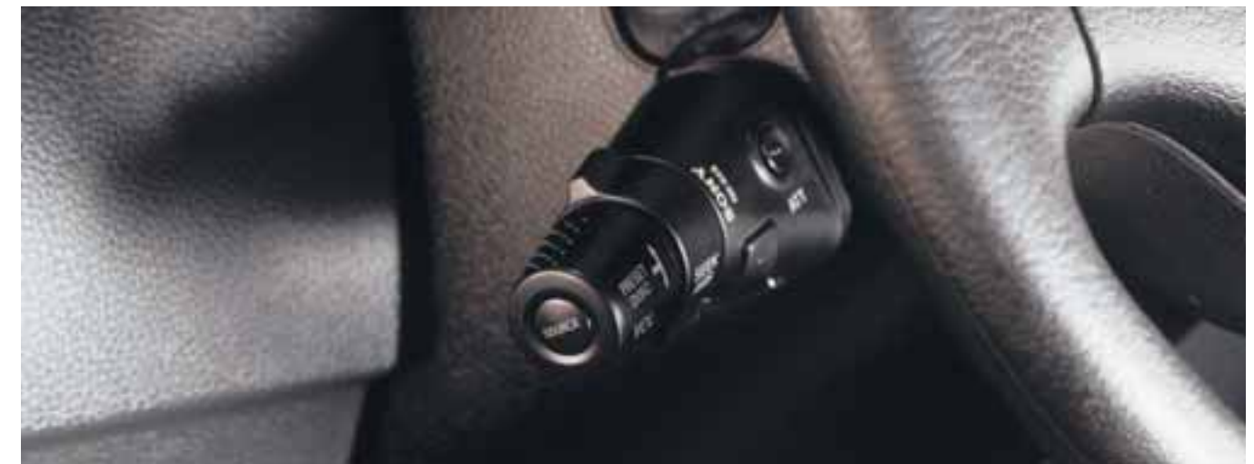
ДЖОЙСТИК • ДИНАМИКИ • АВТОМАГНИТОЛЫ