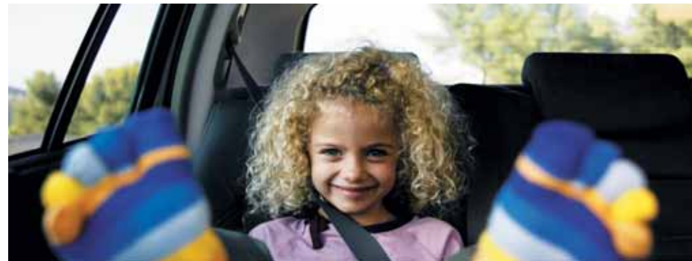
ДЕТСКИЕ КРЕСЛА • СИГНАЛИЗАЦИЯ • ПАРКОВОЧНЫЙ РАДАР • НАБОР АВТОМОБИЛИСТА