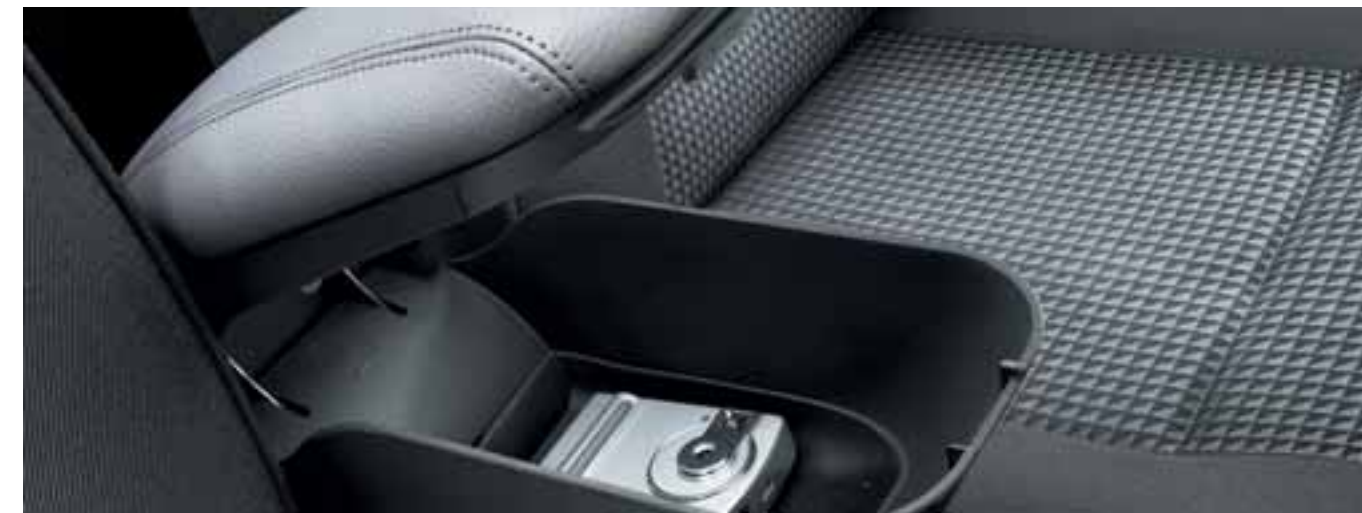
ПОДГОЛОВНИКИ • ЧЕХЛЫ СИДЕНИЙ • КОВРИКИ САЛОНА • ПОДДОНЫ В БАГАЖНИК • СЕТКИ • ВЕШАЛКА